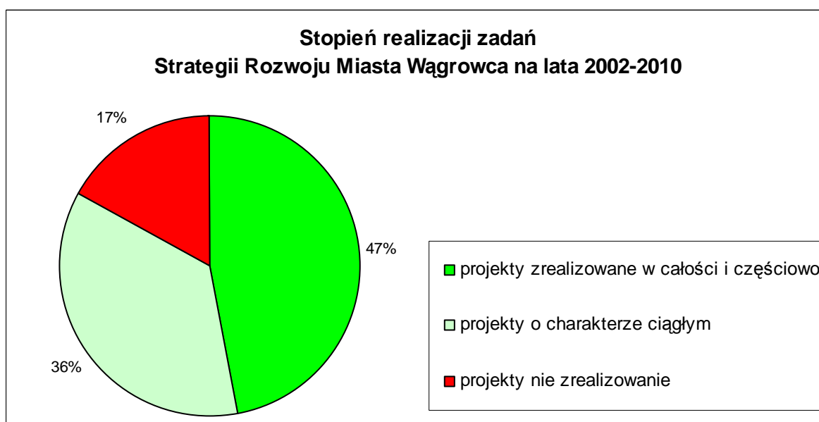
Wykres 2.1. Stopień realizacji zadań Strategii Rozwoju Miasta Wągrowca na lata 2002-2010

W ujęciu statystycznym stopień wykonania zadań, zapisanych w strategii z 2002 roku został przedstawiony na poniższym wykresie.